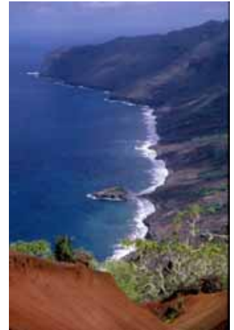
La côte sud-est et le motu MOTU'U constitué de beachrock. Photo M.Charleux-Juillet 1987