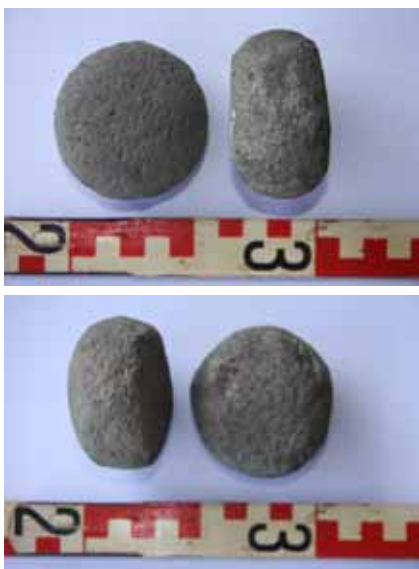
Deux des disques de pierre recueillis sur Eiao en Août 1987 sur les sites ME1/St.63 à gauche et ME1/St.1.B15 à droite.