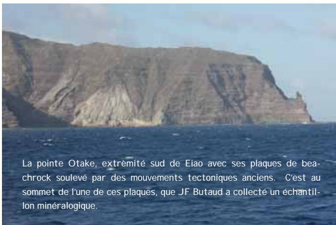
La pointe Otake, extrémité sud de Eiao avec ses plaques de beachrock soulevé par des mouvements tectoniques anciens. C'est au sommet de l'une de ces plaques, que JF Butaud a collecté un échantillon minéralogique.