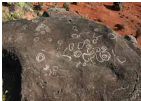
Vue de détail des pétroglyphes